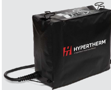
Stofkappen voor het systeem